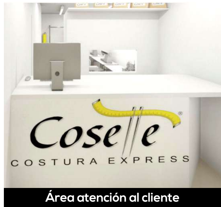
Área atención al cliente